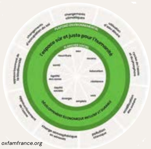
Diagramme de la théorie du Donut – Source : oxfamfrance.org

Entre les deux, se trouve un espace sûr et juste où les êtres humains peuvent évoluer dans une perspective de développement économique inclusif et durable maîtrisé.